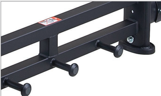
Haken für Therapiebänder